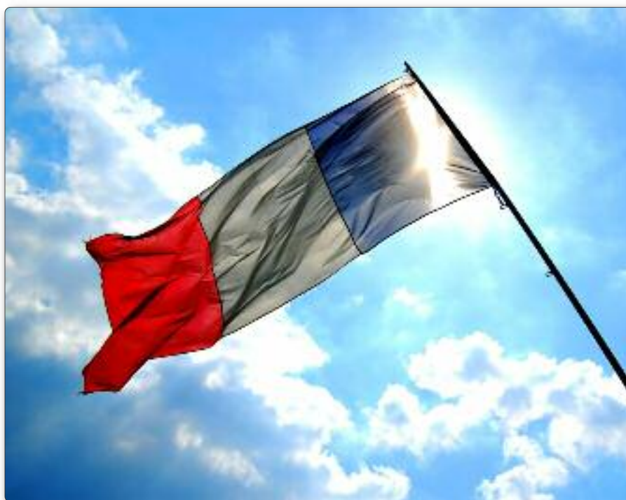
København inkl. Frederiksberg og Århus er gået i front ved at lade tilbuddet om fransk som 2. sprog gælde samtlige skoler