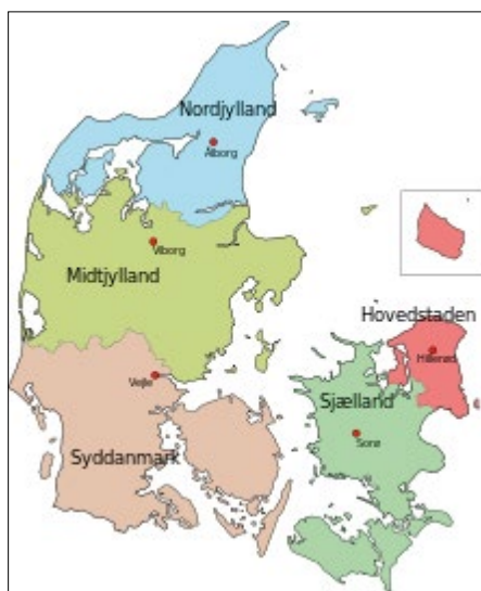
De 5 regioner. Region Hovedstaden er landets folkerigeste region med 1,8 mio. indbyggere oktober 2016. ( https://da.wikipedia.org/wiki/Danmarks_regioner )

land, Sjælland og Syddanmark. Her svinger procenten mellem 9 og 12,5 %. For Region Sjællands vedkommende gælder dog at der intet fransk som 2. fremmedsprog findes på Lolland, Falster og Møn. I hele dette store område er eleverne altså henvist til at gå på privatskole hvis de vil have fransk fra 5. klasse.