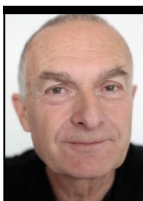
Af Leon Aktor , næstformand i Sproglærerforeningen, formand for Fransk Fagudvalg

Eftersom nogle skoler efter sammenlægning er opdelt i flere afdelinger