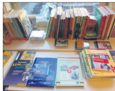
Bogbasar med udstilling af gratis undervisningsmaterialer