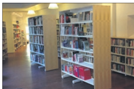
Biblioteket har mere end 6.500 print- og audiovisuelle medier

Jeg gik på opdagelse i de lyse og fine nyindrettede lokaler, hvor det søde og venlige personale bød velkommen med kaffe, lækkerier og en tysksnak.