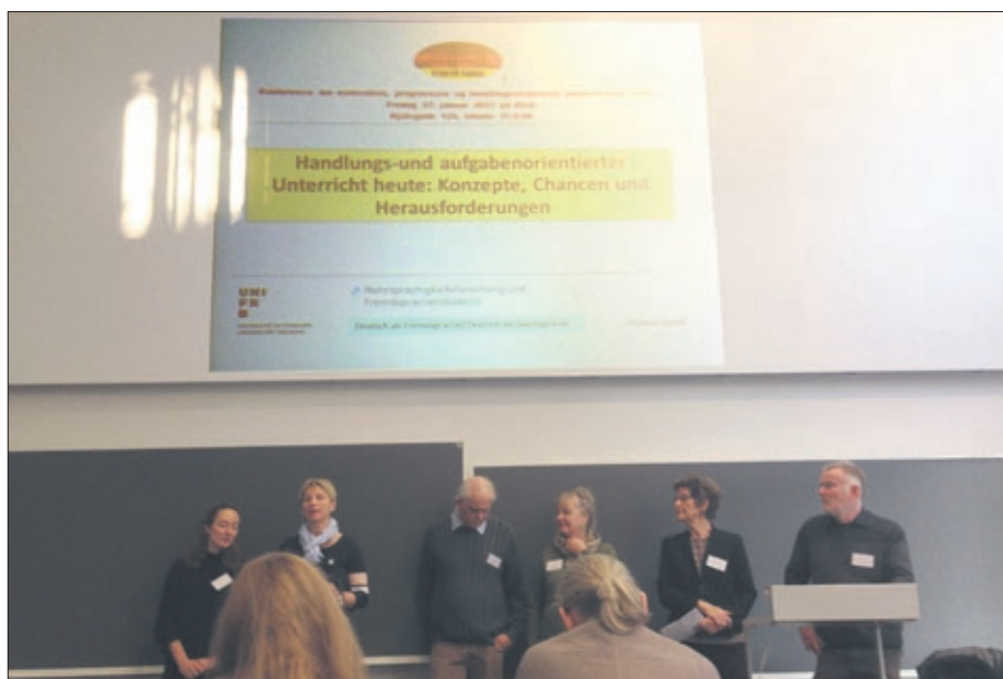
Hovedoverskriften for brobygningskonferencen var: Hvordan kan vi arbejde med handlingsorienteret tysk i folkeskolen, på ungdomsuddannelserne og på de videregående uddannelser, og hvordan kan vi motivere eleverne og understøtte den faglige progression?

Afslutningsvis præsenterede hun to nye tyskprojekter. Det ene med titlen: Brobygning i tyskfaget: Styrket samarbejde mellem tysklærere på tværs af