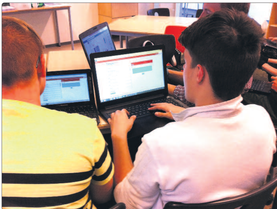
Fordelen ved TodaysMeet er, at det er et lukket chatrum, og at man ikke skal oprette sig som bruger.