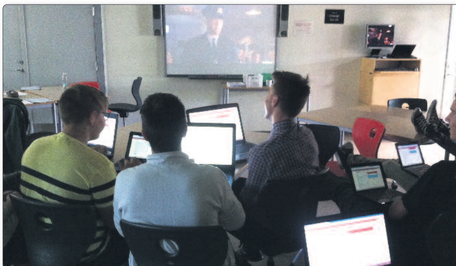
Eleverne ser filmen "The Green Mile" i forbindelse med emnet "Capital Punishment".

I stedet for at gemme spørgsmålene til om en uge logger alle på Todays-