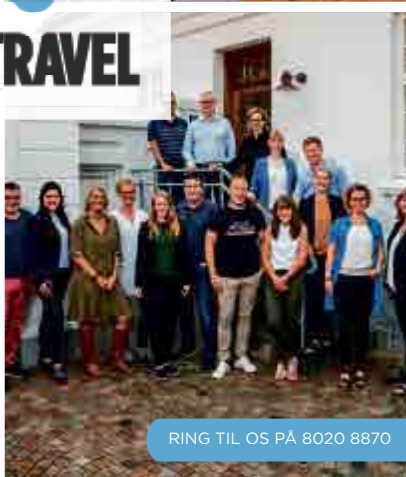
RING TIL OS PÅ 8020 8870