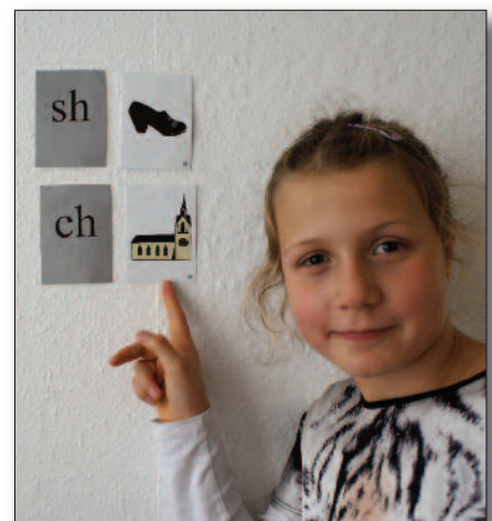
Til hvert fonem hører et nøgleord med et billede. Til lyden sh er nøgleordet shoe og for ch er det church .