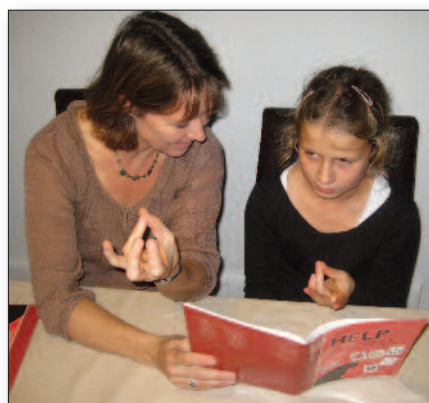
Man benytter bl.a. "tapping" - en slags "fingerstavning".

Det er kun ordblinde og læsesvage elever, der skal gennemgå hele programmet med alle øvelser, men de fleste som lærer engelsk fra grunden kunne givetvis drage nytte af at få